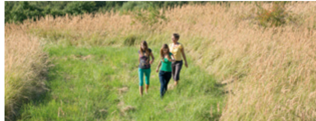
Die rekultivierten Teile sind beliebtes Ausflugsziel und wichtige Naturräume.

Das Artenschutzkonzept am Tagebau Hambach definiert den Rahmen für die professionelle, ökologisch verträgliche Umsiedlung unterschiedlicher Tierarten aus dem Hambacher Forst in die Rekultivierung und die Altwälder des Umlands. So werden mithilfe von Grünbrücken und ökologischer Aufwertung auch Flächen außerhalb des Tagebaus zu neuen Lebensräumen. Durch seine Größe und Qualität ist das Artenschutzkonzept für den Tagebau Hambach deutschlandweit einzigartig.