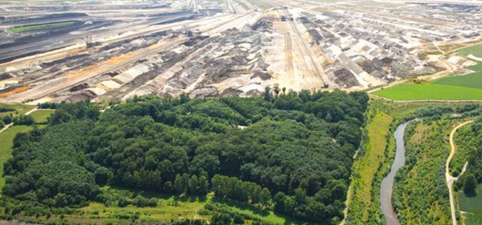
↑ NEUE LANDSCHAFTEN: Nach Beendigung des Tagebaus entstehen neue Lebensräume für Flora und Fauna.

Forschungsstelle Rekultivierung. Der Diplom-Geograf ist in Alt-Otzenrath und Kaster aufgewachsen und hat als Kind erlebt, wie die Bagger immer näherkamen. „Ich wollte selbst an der Neugestaltung der auf links gedrehten Landschaft teilnehmen und dafür sorgen, dass die Region für die Menschen wieder zu einer lebens- und liebenswerten Heimat wird.“ Die Rekultivierung erfolgt natürlich nicht nach dem Motto „Wünsch dir was“. „Die Rahmenbedingungen sind im Braunkohlenplan festgelegt. Aber wir haben Spielraum bei der Ausgestaltung“, erklärt Eßler.