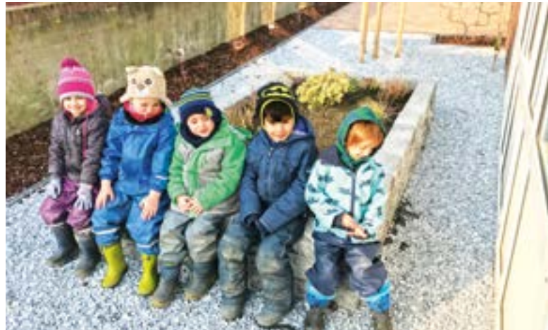
↑ VORFREUDE auf Spiel und Spaß im neuen Außengelände.

Rommerskirchen. Seit einem Vierteljahrhundert besteht die Kindertagesstätte „Sonnenhaus“ in der Gillerstraße. Aus diesem Anlass wurde das weitläufige Außengelände erneuert und für die Kinder mit vielen Bewegungsangeboten attraktiver gestaltet. Mittlerweile haben die Terrassen neue Beläge erhalten. „Wir Eltern freuen uns, wenn die Kinder möglichst viel an der frischen Luft spielen. Mit einer guten Ausstattung können wir die Erzieherinnen und Erzieher in ihrer verantwortungsvollen Tätigkeit unterstützen“, dachte sich RWE-Mitarbeiter Axel Nehring und organisierte die Unterstützung durch die Initiative „RWE Aktiv vor Ort“. Mit dem Geld werden neue altersgerechte Terrassenmöbel angeschafft, damit die Kinder in der wärmeren Jahreszeit wieder mehr Zeit draußen verbringen können. „Das schöne neue Außengelände bietet den Kindern viele Möglichkeiten, ihrer Bewegungsfreude freien Lauf zu lassen“, freut sich Brigitte Kloße, Leiterin der Kindertagesstätte.