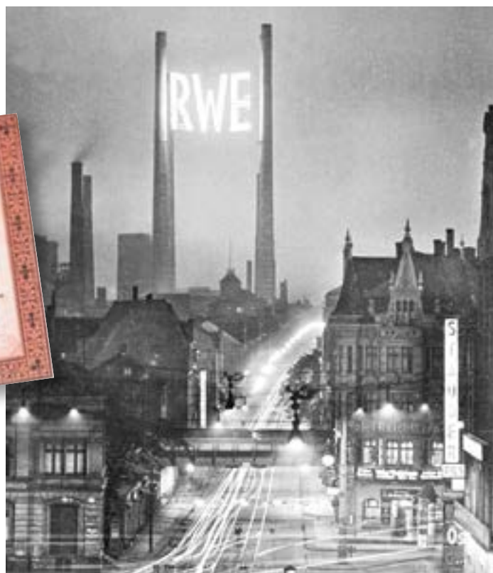
↑ 1900: Kurz nach der Unternehmensgründung übernimmt die RWE-Stammzentrale mit der weithin sichtbaren Leuchtreklame die Stromversorgung in Essen.

Nach der Liberalisierung der Energiemärkte 1998 expandierte RWE durch Unternehmenskäufe in Großbritannien und den Niederlanden international. Die Reaktorkatastrophe von Fukushima