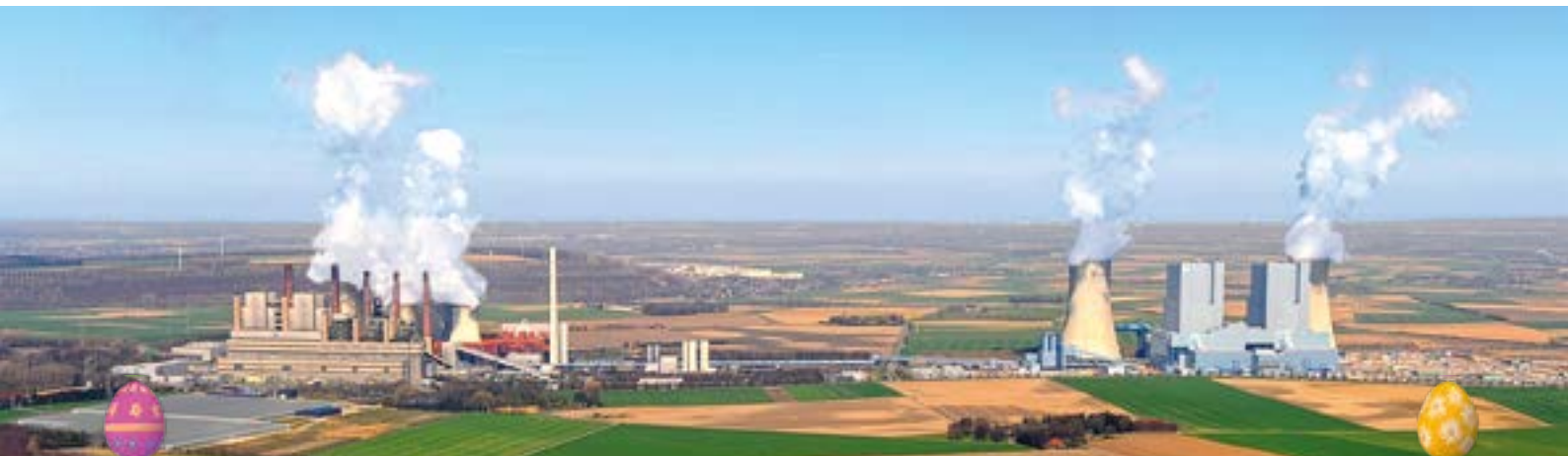
↓ ALT UND NEU: Das Kraftwerk Neurath BoA 2&3 (rechts) ist das weltweit modernste seiner Art. Gegenüber das Bestandskraftwerk aus den 1970er Jahren (links). Hier geht 2019 einer von fünf Blöcken in die Sicherheitsbereitschaft.

Zur langfristigen Nutzung der Braunkohle gibt es große Bemühungen, die Produktion nachhaltiger zu gestalten. RWE verfolgt eine klare Strategie zur Minderung von Kohlendioxid (CO 2 ) bei der Braunkohlenverstromung. Dazu wurden bereits alte Kraftwerksblöcke stillgelegt und die Kraftwerkstechnik verbessert. In Neurath hat RWE 2012 zwei neue Kraftwerksblöcke mit optimierter Anlagentechnik (BoA 2&3) in Dienst gestellt, die einen deutlich höheren Wirkungsgrad haben und dadurch pro Jahr bei gleicher Stromproduktion sechs Millionen Tonnen CO 2 weniger ausstoßen als die dafür stillgelegten Altanlagen. „Es gibt einen Fahrplan für das rheinische Braunkohlenrevier, der im Einklang mit den europäischen und deutschen Klimaschutzzielen steht“, erklärt Lars Kulik, der im Vorstand von RWE Power für das Ressort Braunkohle zuständig ist.